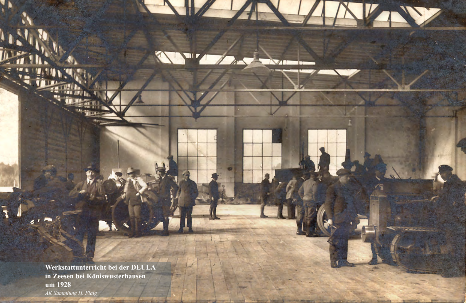
Werkstattunterricht bei der DEULA in Zeesen bei Köniswusterhausen um 1928