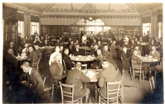
Der Speisesaal im Ausbildungszentrum Zeesen um 1928