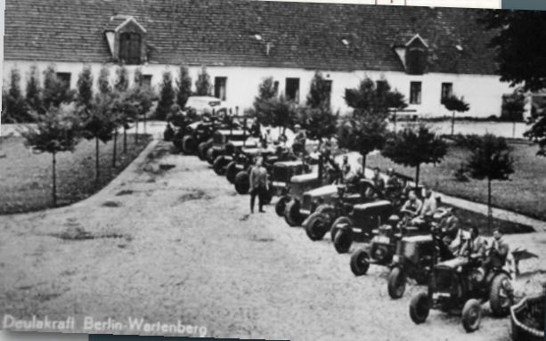
Die DEULA-Ausbildungsflotte in Berlin-Wartenberg um 1936