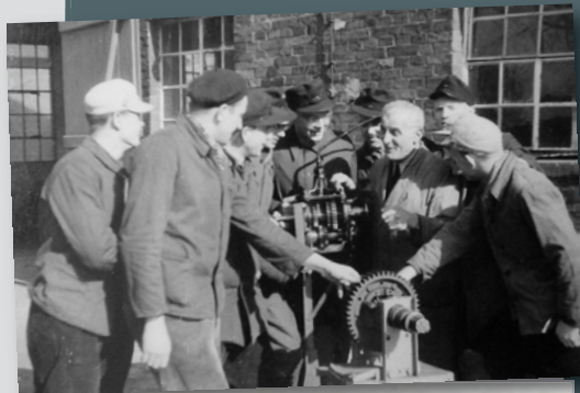
Unterricht in Wartenberg in den 1930er Jahren