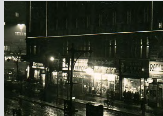
Aschinger-Filiale im Hotel Fürstenhof am Potsdamer Platz um 1936.

Einmal an einer endlosen Bretterwand entlang der Straße blieben wir staunend stehen und versuchten durch die schmale Fugen ins Innere zu sehen. Eine riesige Baugrube tat sich vor unseren Augen auf. Sofort kam ein älter-