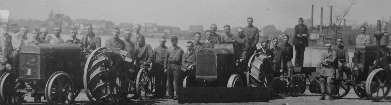
Deulakraft-Karawane I, „Dt. Krone“, 1929