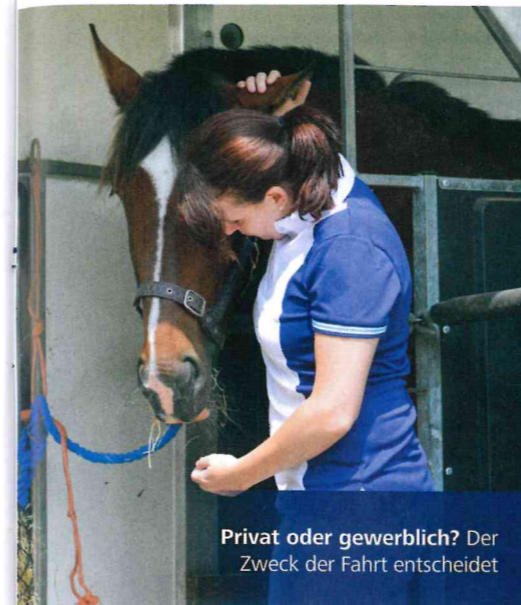
Privat oder gewerblich? Der Zweck der Fahrt entscheidet

Zu finden ist die Verordnung über folgenden Link: → https://eur-lex.europa.eu/homepage.html?locale=de .