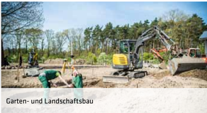
Garten- und Landschaftsbau

Verkehrsgünstige Lage im Norden von Warendorf. In unmittelbarer Nähe zur Deutschen Reiterlichen Vereinigung (FN), zur Sportschule der Bundeswehr und zum Nordrhein-Westfälischen Landgestüt.