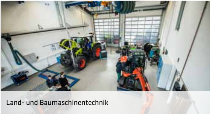
Land- und Baumaschinentechnik